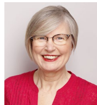
Gabriele Hiller-Ohm, Mitglied des Deutschen Bundestags