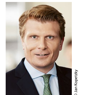
Thomas Bareiß, parlamentarischer Staatssekretär, BMVI