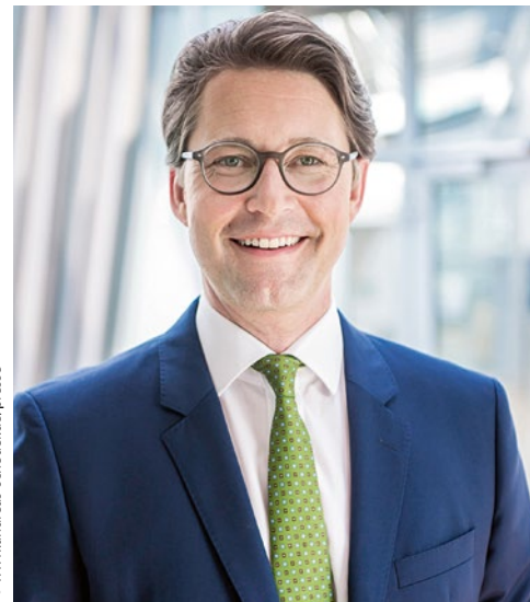
Andreas Scheuer, Bundesminister für Verkehr und digitale Infrastruktur

Über 500 Zuschauerinnen und Zuschauer verfolgten am 24. Februar an ihren Bildschirmen das erste Politik-Forum des Bundesverbands Deutscher Omnibusunternehmer (bdo). In zwei digitalen Podiumsdiskussionen tauschten sich Vertreterinnen und Vertreter des bdo mit führenden Politikerinnen und Politikern aus den Bereichen Verkehr und Tourismus aus. Es ging – natürlich – um die Zukunft von Bustouristik und ÖPNV im Zeichen der Corona-Krise. In seinem Grußwort unterstrich Bundesverkehrsminister Andreas Scheuer die Rolle des Busses für den Mobilitätsmix der Zukunft und dessen Potenziale im Kampf gegen den Klimawandel.