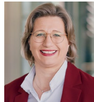
Anke Rehlinger, stellv. Ministerpräsidentin, Verkehrsministerin Saarland