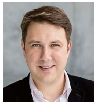
Markus Tressel, Mitglied des Deutschen Bundestags