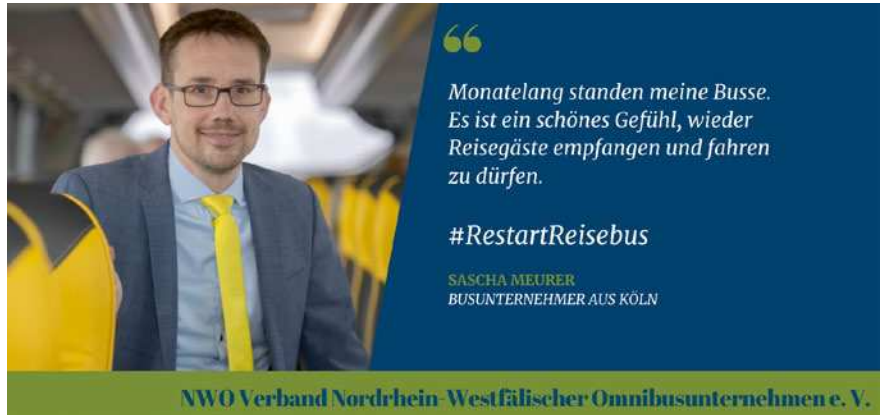
Mit positiven Botschaften fordert der NWO in seiner Social-Media-Kampagne den #RestartReisebus