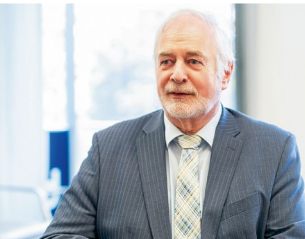
bdo-Präsident rief Bundesverkehrsminister Scheuer auf, das Rettungsprogramm für Reisebusunternehmen neu aufzulegen

viele Busfahrerinnen und Busfahrer auf absehbare Zeit nicht Berücksichtigung finden können. Wir appellieren an alle Bundesländer, hier unbürokratisch nachzusteuern. Keine Landesregierung kann es wollen, dass die Männer und Frauen am Steuer der Busse nicht frühzeitig geschützt werden. Dafür müssen jetzt die entsprechenden Schritte schnell eingeleitet werden.“