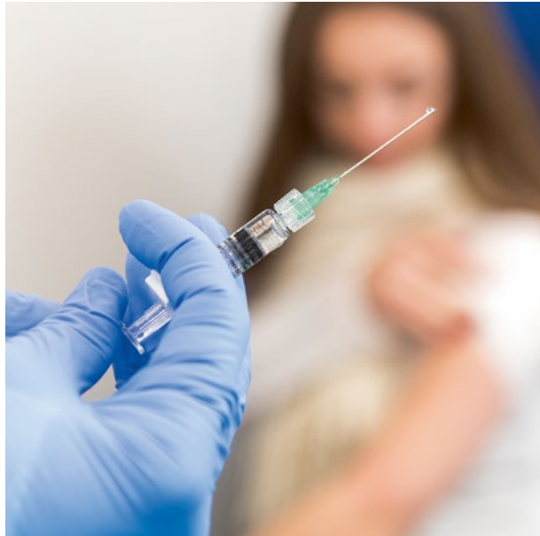
Der bdo fordert: Beschäftigte in Busunternehmen sollen schnell Zugang zu Impfungen erhalten