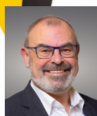
Franz Schweizer Präsident WBO