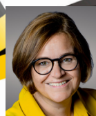
Silke Gericke MdL, GRÜNE Verkehrspolitische Sprecherin Landtag Baden-Württemberg